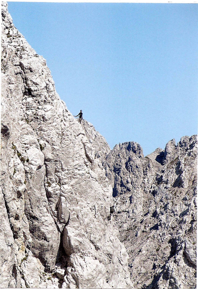
Seilschaft in der 13.SL